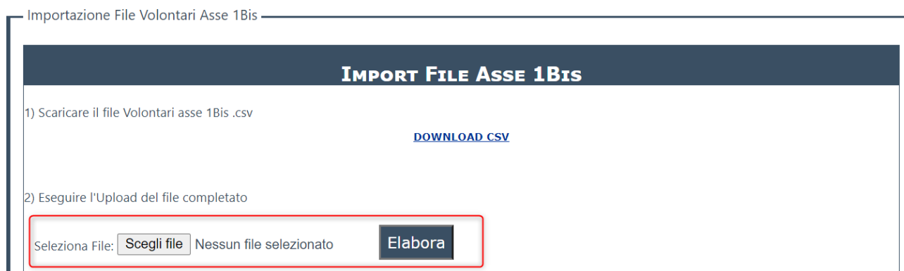
Figura 5 Selezione del file da importare

Completato il popolamento delle informazioni sul file secondo i criteri indicati è possibile procedere all'importazione sul sistema.