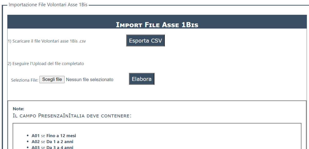
Figura 2 Pagina di importazione file

La figura 2 mostra la pagina di importazione file volontari asse 1 bis.