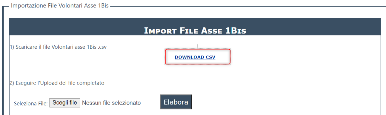
Figura 3 Collegamento al file CSV prodotto

Per reperire il file CSV da compilare è sufficiente cliccare sul pulsante “Esporta CSV” presente nella pagina. Il sistema elabora la richiesta e visualizza il collegamento “Download CSV” (evidenziato in figura 3) dal quale l'ente può scaricare il file prodotto.